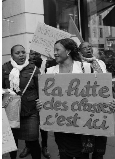
Salariés en grève de l'hôtel Hyatt