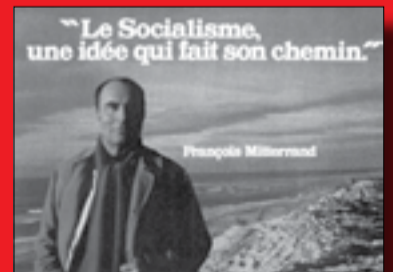
Affiche pour les élections Municipales de mars 1977.

31 janvier 1956 au 8 janvier 1959 Gouvernement Guy Mollet, puis participation à tous les gouvernements ultérieurs.