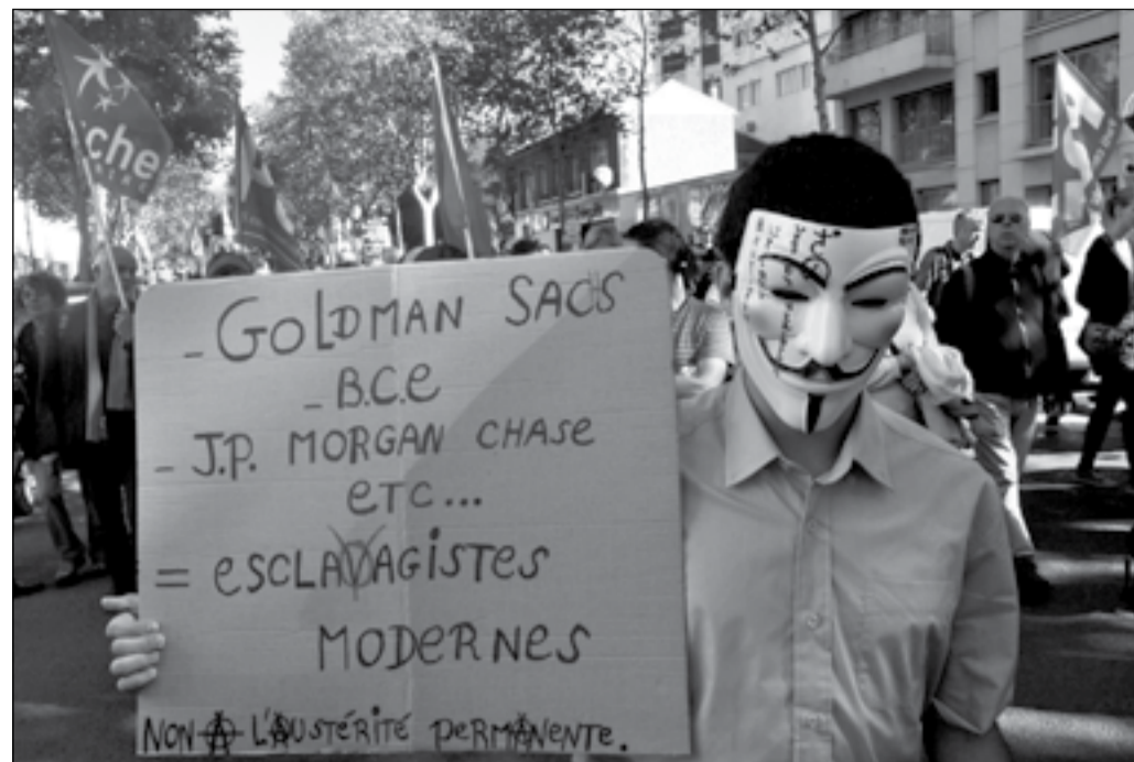
Manifestation contre le TSCG à Paris le 30 septembre 2012.

Hollande « An I » a fait une politique qui a ravi le Medef. Hollande « An II » s'adresse d'abord