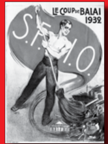
Affiche de la SFIO pour les élections législatives de 1932.

26 août 1914 Face à l'« agression » de la France, Jules Guesde, Marcel Sembat et Albert Thomas sont ministres dans le gouvernement d'union nationale. Il y aura la présence de socialistes dans tous les gouvernements jusqu'en septembre 1917.