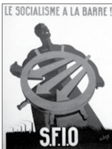
Affiche de la SFIO pour les élections à l'Assemblée constituante de 1945.

Sans s'illusionner sur la façon dont s'appliquent ces déclarations, ce qui est déterminant c'est ce que font les gouvernements : on est passé du refus affiché de participer à un gouvernement socialiste à l'objectif de gérer une économie de marché !