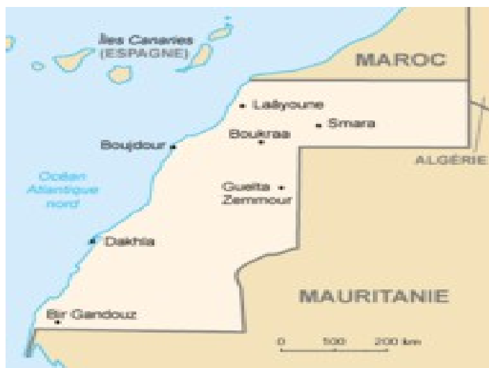
Le Sahara occidental

Le Sahara Occidental est rarement l'invité de nos médias français populaires, et ne doit une certaine attention qu'à quelques personnes vigilantes. Et pourtant la situation est embourbée depuis des décennies sur fond de concessions sur le droit international.