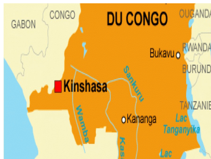
La République Démocratique du Congo

Si la mise hors d'état de nuire du groupe armé M23, soutenu officieusement par les autorités rwandaises, par l'action conjuguée des forces armées de la République Démocratique du Congo (FARDC) et de la brigade d'intervention de la Monusco est une bonne chose, d'autres milices continuent à sévir. La plus ancienne, les Forces démocratiques de libération du Rwanda, est à l'origine formée par les extrémistes hutu, responsables du génocide des Tutsi au Rwanda en 1994 réfugiés en RDC après l'arrivée du FPR, grâce à l'opération Turquoise menée par l'armée française.