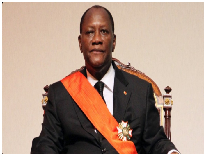
Ouattara, Maître de Côte d'Ivoire

FP : Les candidats de l'opposition, dont des anciens alliés de Ouattara, estiment à propos de la présidentielle du 25 octobre que les conditions pour un scrutin transparent et équitable ne sont pas réunies. « Ce scrutin ne s'annonce ni ouvert, ni régulier. Si nous n'y prenons garde, nous nous acheminons vers une crise postélectorale de plus », a déclaré Amara Essy, un des candidats et ancien ministre des Affaires étrangères de Houphouët-Boigny. « Nous savons tous que la majorité des Ivoiriens ne se sent pas concernée par cette élection », a-t-il aussi dit. Il est vrai que Ouattara contrôle les organes du processus électoral : son parti est toujours majoritaire au sein de la Commission électorale indépendante et du Conseil constitutionnel. L'opposition, elle, est très affaiblie. Le pouvoir a notamment réussi à faire exploser le FPI.