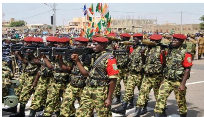
Le RSP, une force de répression

Le rôle personnel de Blaise Compaoré dans le putsch récent (désormais avorté) n'est pas totalement clair : les putschistes souhaitent-ils faire revenir Compaoré... ou, plutôt, instaurer un régime compaoriste sans Compaoré ? Le débat n'est pas tranché, même s'il existe – voir plus haut – des indices qui font penser à une implication personnelle de Blaise Compaoré. Ce qui est sûr et certain, en revanche, c'est le caractère ouvertement réactionnaire de leurs visées.