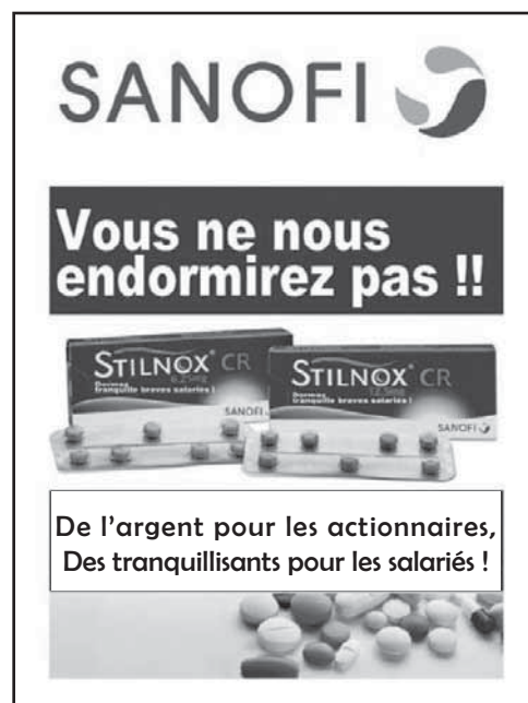
Extrait d'un tract des grévistes