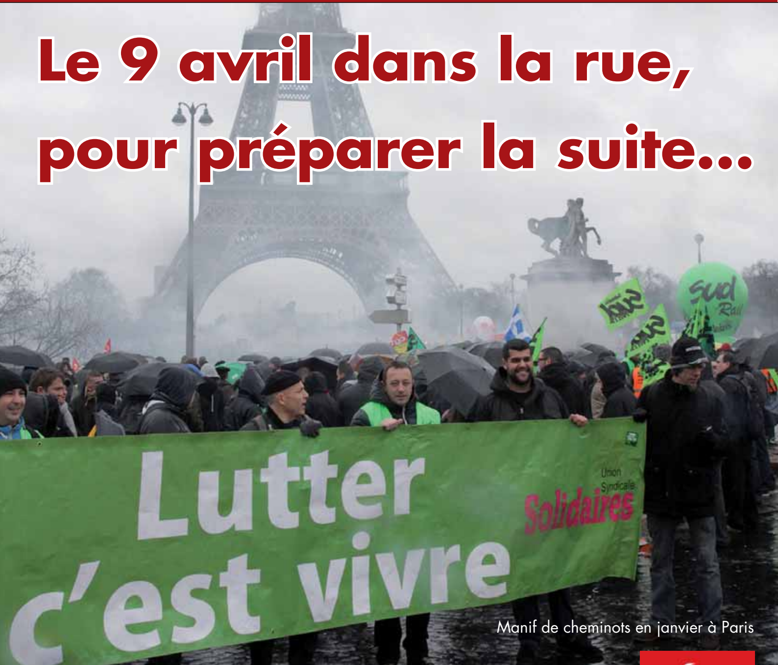
Manif de cheminots en janvier à Paris