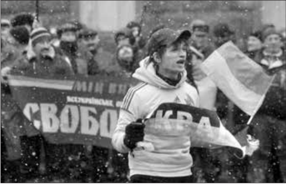
Manifestants devant le siège du gouvernement le 6 décembre.

Mais on est loin d'une nouvelle «Révolution orange», c'est à-dire de manifestants se reconnaissant dans les programmes des «candidats Orange» qui ont succédé au régime de Léonid Koutchma (1993-2004) portés par l'espoir populaire d'un régime non corrompu. Les désillusions ont été rapides, expliquant le