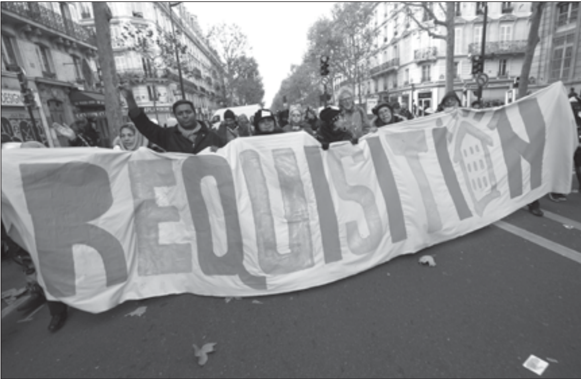
Une belle banderole dans la manifestation du 30 novembre à Paris.