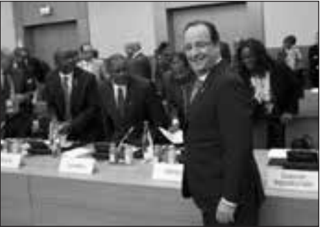
Le 7 décembre à Paris.

Parmi eux se trouvaient Idriss Déby qui, arrivé au pouvoir au Tchad il y a 23 ans, y règne par la terreur et aurait depuis longtemps dû céder la place sans le soutien constant de l'armée française (face, notamment, aux rébellions qui, en 2005-2006, manquent de peu de le chasser). Étaient aussi là le Congolais Denis Sassou Nguessou, figure emblématique de la corruption à grande échelle des dirigeants africains, en place de 1979 à 1992 et, à l'issue d'une guerre civile, à nouveau sans interruption depuis 1997... Sans oublier Faure Gnassingbé et Ali Bongo, à qui un coup d'État dans le cas du président togolais et la fraude électorale pour l'actuel président gabonais, ont permis de succéder à leurs pères qui avaient régné respectivement 40 et 42 ans. Et enfin Blaise Compaoré, solidement installé depuis le meurtre de son compagnon Thomas Sankara, il y a 26 ans.