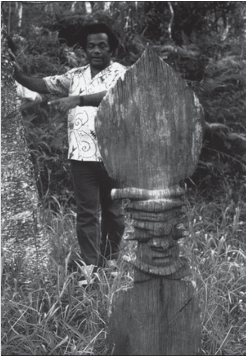
Jean-Marie Tjibaou, 1979.

N i la majorité de l'Union calédonienne (UC) ni les militants du Parti de libération kanak (Palika) n'avaient approuvé la « voie culturelle » choisie par Jean-Marie Tjibaou (1936-1989) avec l'organisation en 1975 du festival artistique Melanesia 2000, soutenu par des fonds de l'État colonisateur, et préfigurant la « voie légale » de conquête du pouvoir qui le porterait à la tête du conseil de gouvernement de Nouvelle-Calédonie dès 1982. Cette « modération » lui valut des inimitiés allant jusqu'à son meurtre 7 ans plus tard. Il faudra attendre le « référendum d'autodétermination » prévu entre 2014 et 2018 et ses suites pour juger des résultats à longue portée des choix politiques de Tjibaou. Mais ses efforts pour revivifier la culture kanak (« un peuple qui ne crée plus est un peuple en sursis ») et pour articuler traditions mélanésiennes et revendications nationalistes et sociales contemporaines furent vite une réussite incontestable et le restent des décennies plus tard, comme en témoigne l'exposition actuellement visible à Paris. Dès le début des années 1980, Tjibaou avait demandé à deux spécialistes, l'ethnologue Roger Boulay et Emmanuel Kasarhérou, le premier conservateur mélanésien du musée de Nouméa, d'entreprendre l'inventaire des œuvres d'art kanak dispersées à travers le monde, et une première grande exposition dédiée à sa mémoire, avec un beau texte d'Aimé Césaire, eut lieu à Paris en 1990. Il n'y en eut plus de cette ampleur jusqu'à celle-ci, qui présente