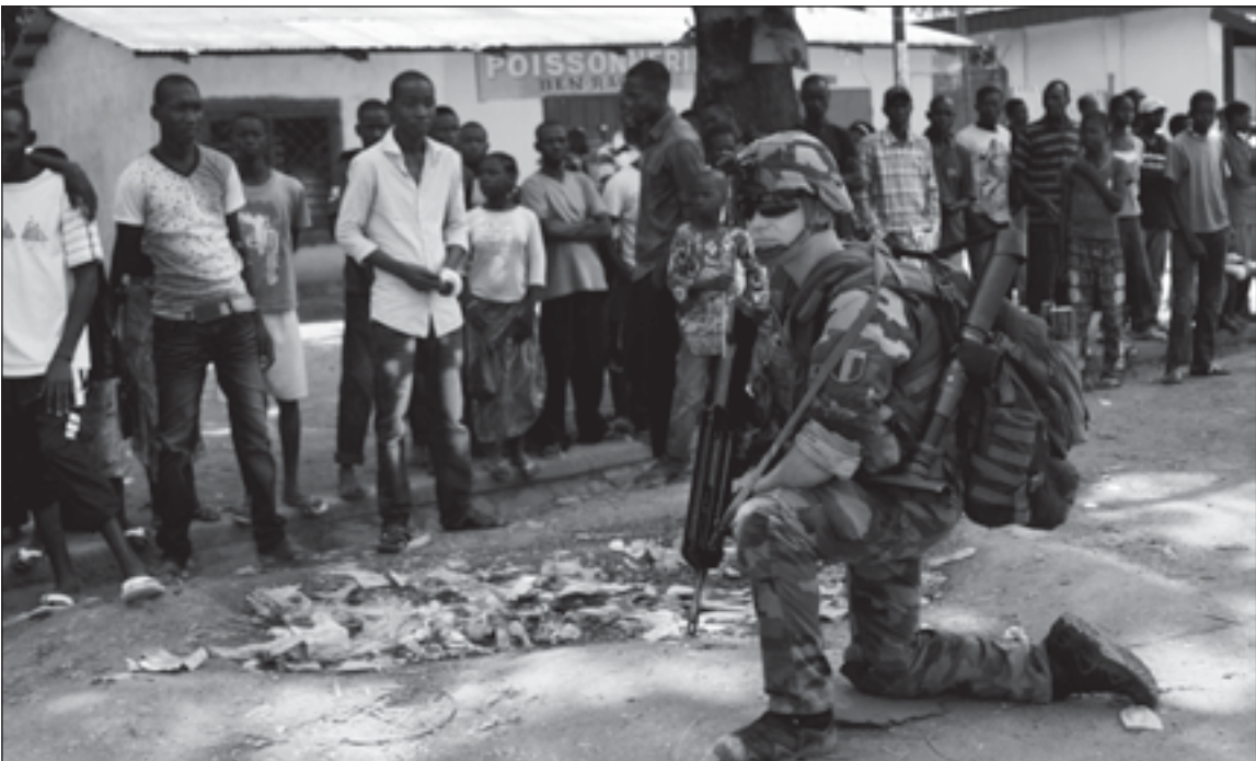
Un soldat français à Bangui le dimanche 8 décembre 2013.

L'annonce de l'intervention française vient de susciter de nouvelles flambées de violence. Ainsi, à la fin de la semaine dernière, une attaque coordonnée a eu lieu dans la capitale centrafricaine Bangui, probablement menée par les anciens partisans du président déchu François Bozizé renversé par la Seleka.