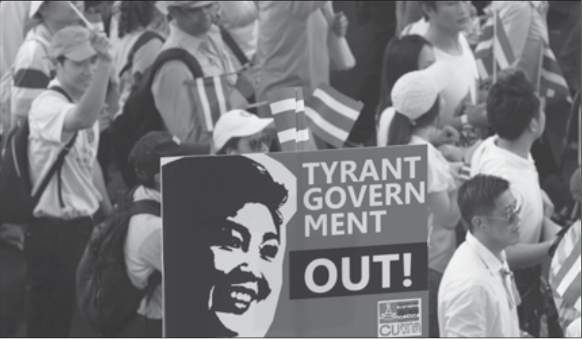
Des opposants au gouvernement thaïlandais.

Problème : l'opposition ne veut pas laisser le peuple décider tant elle craint de perdre les élections. Le scénario s'est produit depuis 2006 de façon répétée quand le parti de Thaksin Shinawatra (frère de l'actuelle Première ministre et lui-même ancien Premier ministre) a été renversé par des coups d'État plus ou moins avoués, mais a regagné haut la main les élections qui ont suivi. Rien n'indique que le fort mal nommé Parti démocrate, à la tête de l'opposition parlementaire, ait depuis élargi sa base électorale, limitée pour l'essentiel à Bangkok et au Sud. De plus, un vent très réactionnaire souffle sur les classes moyennes et les élites de la capitale. Le principe même du suffrage universel est remis en cause, les «masses» ignares ne pouvant à leurs yeux voter avec raison. Ainsi, Suthep Thaugsuban, l'actuel chef de file des manifestations anti-Thaksin, exige la création d'un (encore une fois mal nommé) «conseil du peuple» non élu, en lieu et place du gouvernement. La nomination par le roi de l'homme d'affaires Thaksin Shinawatra au