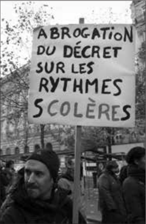
Dans les rues de Paris, jeudi 5 décembre.

Avec 40 à 50 % de grévistes, le chiffre n'est pas mauvais, d'autant qu'il s'agissait pour certaines villes de la septième journée de grève en un an. Mais il est clairement décevant quand on sait que, FO, CGT et Sud, très minoritaires, et la moitié des sections départementales du SNUipp-FSU avaient réussi à entraîner autant de monde un mois avant. Dans les secteurs militants, la discussion se mène sur les raisons de ce relatif échec. Ce qui remonte au premier plan est le « manque de détermination » du syndicat majoritaire, le SNUipp. Malgré la pression de nombreuses sections locales, la direction aura vraiment tout fait : à quelques jours de la grève des 13 et 14 novembre, elle aura proposé cette grève début décembre, ce qui a eu pour effet de diviser ceux qui étaient prêts à attendre et ceux qui voulaient partir tout de suite. La grève du 5 décembre est du coup apparue comme trop tardive, et sabote les possibilités de grève reconductible puisqu'elle est organisée à une semaine des remises de livrets et deux semaines des vacances de fin d'année. C'est tout le paradoxe de la situation... Jamais le syndicat majoritaire n'a eu de position aussi combative : alors qu'il était clairement favorable à la réforme l'an dernier, il s'affiche aujourd'hui « pour une réécriture complète du décret » sur les rythmes scolaires ; jamais les jalons pour une mobilisation nationale n'ont été aussi bien