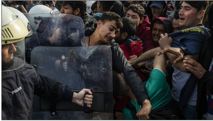
Lesbos, le 3 mars.