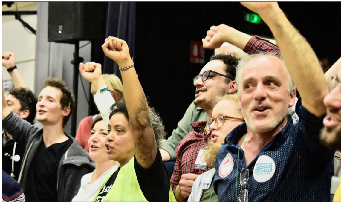
BORDEAUX EN LUTTE

On a une grosse bataille en perspective car nous serons confrontés à la pression du vote «utile». Le maire en place, juppéiste, symbole de 72 années de droite, est sérieusement menacé par «l'opposant»