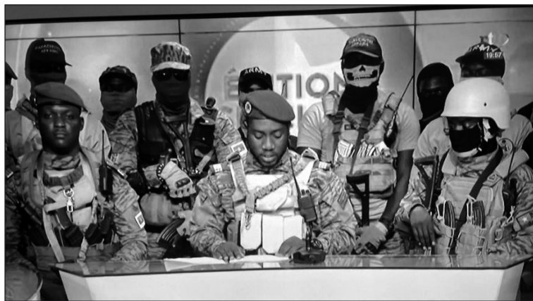
Le capitaine Kiswendsida Sorgho.

L'élément principal du déclenchement de ce second coup d'État est le bilan désastreux de Damiba. Si, lors de sa prise de parole le 4 septembre, le lieutenant-colonel s'est lancé dans un exercice d'autosatisfaction, il n'a convaincu personne. Pas même lui, puisqu'il a limogé son ministre des Armées pour occuper ce poste en sus de la présidence de transition. De tous les pays du Sahel, le Burkina Faso est celui qui connaît la plus forte augmentation des attaques des deux groupes islamistes : le JNIM, affilié à Al-Qaïda, et l'État islamique dans le Grand Sahara (EIGS). Dix régions, sur treize que compte le Burkina Faso, sont touchées. Les opérations des combattants islamistes se traduisent par le contrôle de zones dans plusieurs régions du pays. C'est ainsi que le JNIM assoit son pouvoir sur une grande partie des provinces du Louroum et du Yatenga situées dans le nord du pays et avance vers la capitale