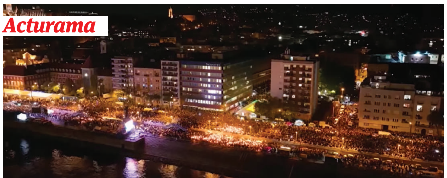
Photo : Des foules impressionnantes célèbrent la défaite de Viktor Orbán dans les rues de Budapest (DR).

Défaite de Viktor Orbán et de l'internationale fasciste. La défaite de Viktor Orbán constitue un revers pour l'internationale fasciste dont il était un pivot. De Donald Trump à Benjamin Netanyahu, en passant par Vladimir Poutine, Marine Le Pen et Giorgia Meloni, l'extrême droite mondiale s'était pourtant mobilisée pour sa réélection. Orbán incarnait leur modèle : attaques contre les droits démocratiques, répression des opposantEs, politique raciste anti-migrantEs, offensive contre les droits des femmes et des LGBTI+. Certes, le vainqueur est un conservateur, loin de toute rupture avec les politiques néolibérales. Mais en ces temps de fascisation mondiale, la défaite d'Orbán reste une bonne nouvelle.