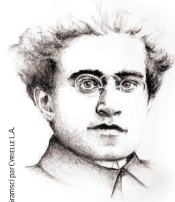
Gramsci par Corelle L.A.

Il s'agit donc d'un terrain d'affrontements sur lequel la classe dominée doit aussi défendre ses intérêts. Une « guerre de position »