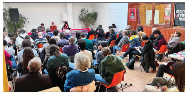
CEM, lundi 13 avril 2026. NPA-A