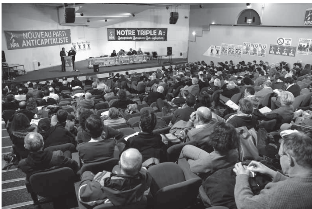
2 ème Congrès du NPA - Photothèque Rouge Milo

Répondre à cette situation implique d'analyser les ruptures profondes entre les classes populaires, la jeunesse, et la gauche, mais aussi avec les institutions, le « système », comme en atteste les luttes récentes. Comment répondre ? Quel projet formuler qui soit en phase avec les exigences sociales de la classe ouvrière d'aujourd'hui et qui soit porteur d'une perspective d'un autre pouvoir, un pouvoir des travailleurs ? Comment être utiles aux luttes telles qu'elles sont, aider les travailleurs, la jeunesse, à aller jusqu'au bout des révoltes collectives ? Comment aider à reconstruire une conscience de classe, celle d'être une force porteuse des intérêts du plus grand nombre ? A travers ces problèmes, c'est aussi celui de l'unité pour agir qui est en débat, comment la construire, sur quelles bases, avec qui ? Les questions du climat, des droits des femmes, de l'extrême-droite, et de notre intervention dans les entreprises seront aussi l'objet de débats et de travaux.