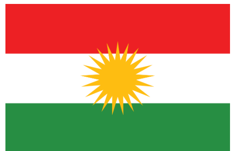
Drapeau du gouvernement régional du Kurdistan, généralement accepté comme drapeau national par le peuple kurde