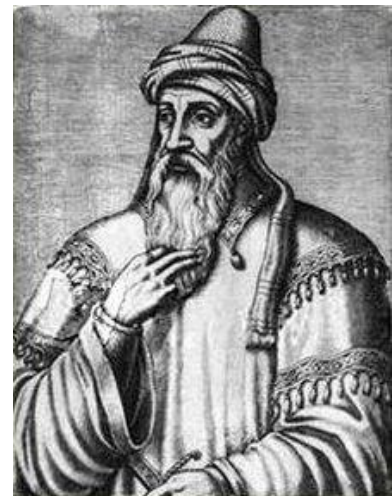
Saladin (1138 - 1193)

Cependant, dès le Xème siècle, une partie du territoire « kurde » est organisé en quatre grandes provinces. Le terme même de Kurde apparaît formellement en 1150. En 1169, un émir kurde de l'armée de Syrie, Salah-Ad-Din, ou Saladin, devient roi d'Egypte. Son pouvoir s'étend du Yémen à l'Egypte, de la Syrie à la Haute Mésopotamie. A travers son rôle dans la guerre contre les croisés d'Occident, Saladin est sans doute le Kurde le plus célèbre en Europe. Il meurt en 1193.