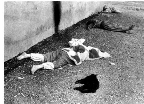
Attaque chimique d'Halabja le 16 mars 1988

Plus sinistre encore que l'histoire des Kurdes d'Irak est celle des Kurdes de Turquie. Il est impossible de chiffrer le nombre des exactions commises par la Turquie à l'égard du peuple kurde. TOUS les partis créés depuis l'origine de la Turquie moderne ont été interdits ou dissous. Tous les hauts responsables politiques kurdes ont été assassinés, au mieux jetés en prison et torturés. L'appellation même de « Kurde » a été longtemps interdite, la seule autorisée étant celle de « Turc des montagnes ».