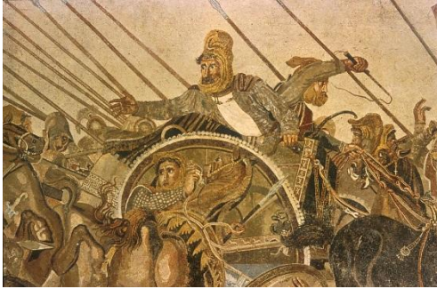
Darius III (v. 380 av. J.-C. - 330 av. J.-C.)

On pense généralement que le peuple kurde descend des Mèdes de l'Antiquité. Ces derniers auraient été soumis par le roi des Perses Cyrus II en 550 avant J.-C., c'est pourquoi ils apparaissent auprès des Perses lors des « guerres médiques » contre une partie de la Grèce, Athènes notamment. Comme le dit un historien contemporain, les Mèdes sont aux Kurdes ce que les Gaulois sont aux Français.