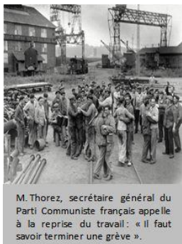
M. Thorez, secrétaire général du Parti Communiste français appelle à la reprise du travail: « Il faut savoir terminer une grève ».