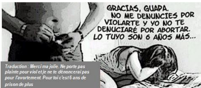
Traduction : Merci ma jolie. Ne porte pas plainte pour viol et je ne te dénoncerai pas pour l'avortement. Pour toi c'est 6 ans de prison de plus

Le combat pour la liberté des droits des femmes, en Espagne comme ailleurs, droit de choisir d'être mère ou pas, avortement libre et gratuit, gratuité des moyens contraceptifs... est l'affaire de toutes et de tous ! Ce combat nous le mènerons encore et toujours car il n'est pas dit que l'Espagne montrant la voie d'autres pays ne la suivent !