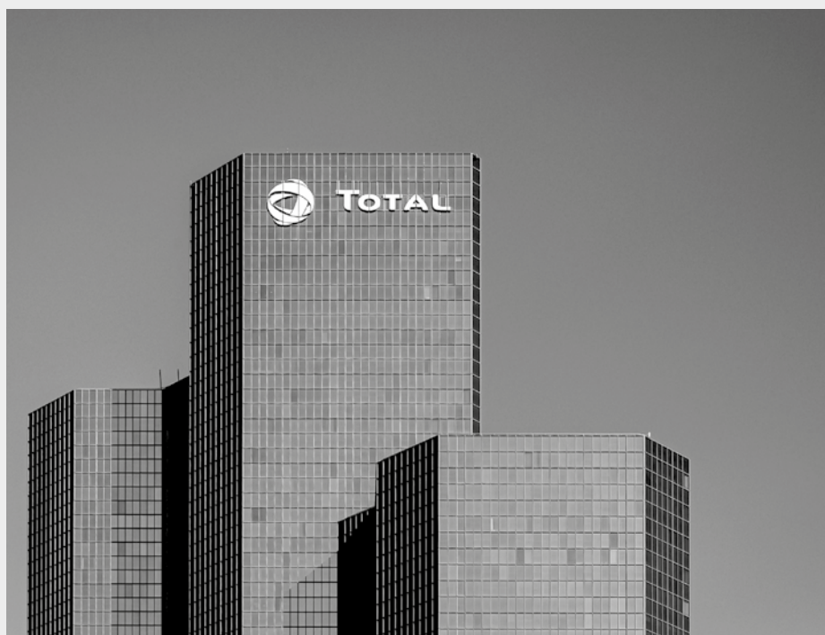
Siège de Total à La Défense, Nanterre, 5 novembre 2020.

De l'argent, il y en a dans les poches du patronat ! □