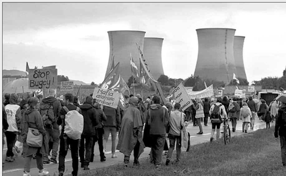
Manifestation contre le projet avancé de construction de 2 nouveaux réacteurs EPR et le développement du site ICEDA de stockage de déchets, 3 octobre 2021.

Selon un lanceur d'alerte travaillant dans l'industrie nucléaire 10 , la détérioration des assemblages de combustibles à l'origine de l'arrêt de l'EPR de Taishan (Chine) serait dû à un défaut de conception de la