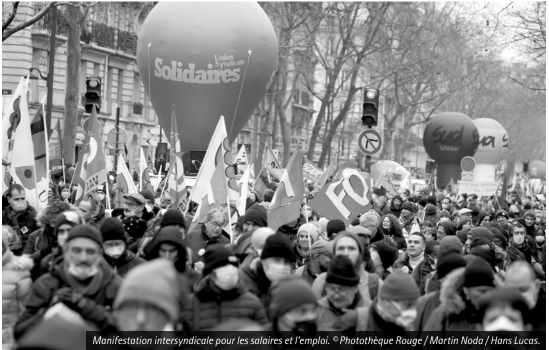
Manifestation intersyndicale pour les salaires et l'emploi.

Car nul doute que les pressions vont être de plus en plus fortes sur l'ensemble de notre camp social dans les prochains mois pour que les profits soient préservés. Comme elles ont été ces dernières années. Depuis 2017, le gouvernement Macron a accéléré la casse de l'État providence et des services publics, commencée bien avant lui, avec les résultats que l'on sait à l'hôpital et dans l'éducation, tout en