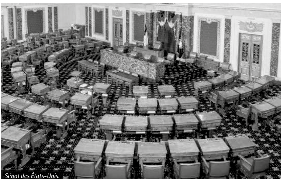
Sénat des États-Unis.