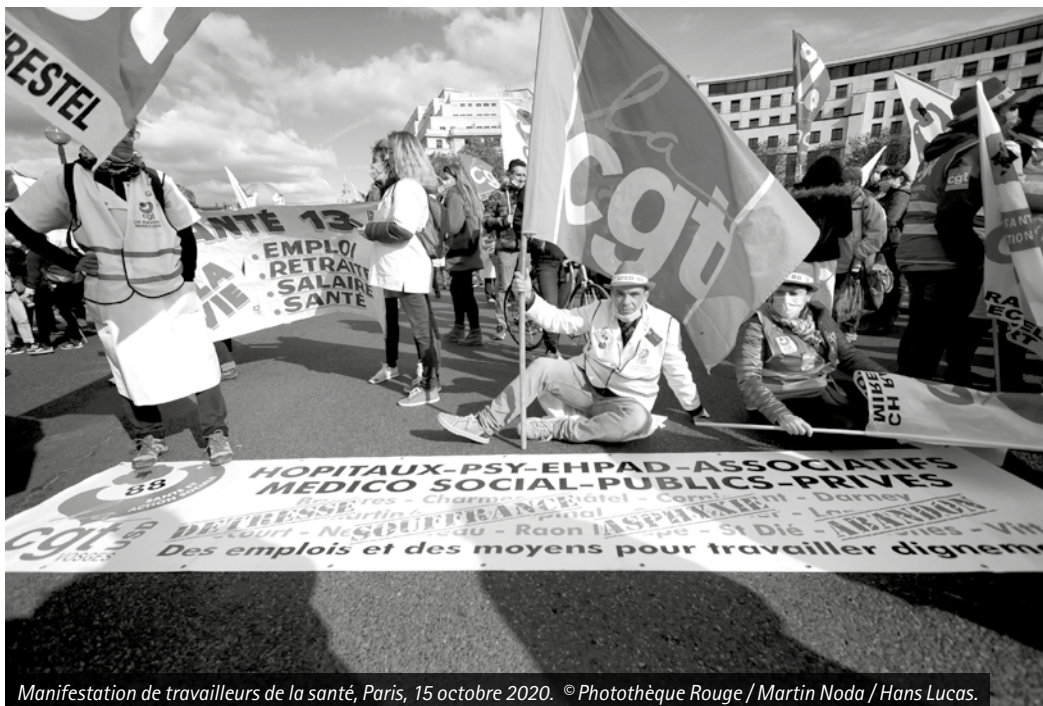
Manifestation de travailleurs de la santé, Paris, 15 octobre 2020. ©Photothèque Rouge / Martin Noda / Hans Lucas.

méthode du pouvoir ne fut pas la bonne. Faute d'avoir réquisitionné l'industrie pharmaceutique pour répondre aux besoins, le démarrage de la campagne fut lent et chaotique.