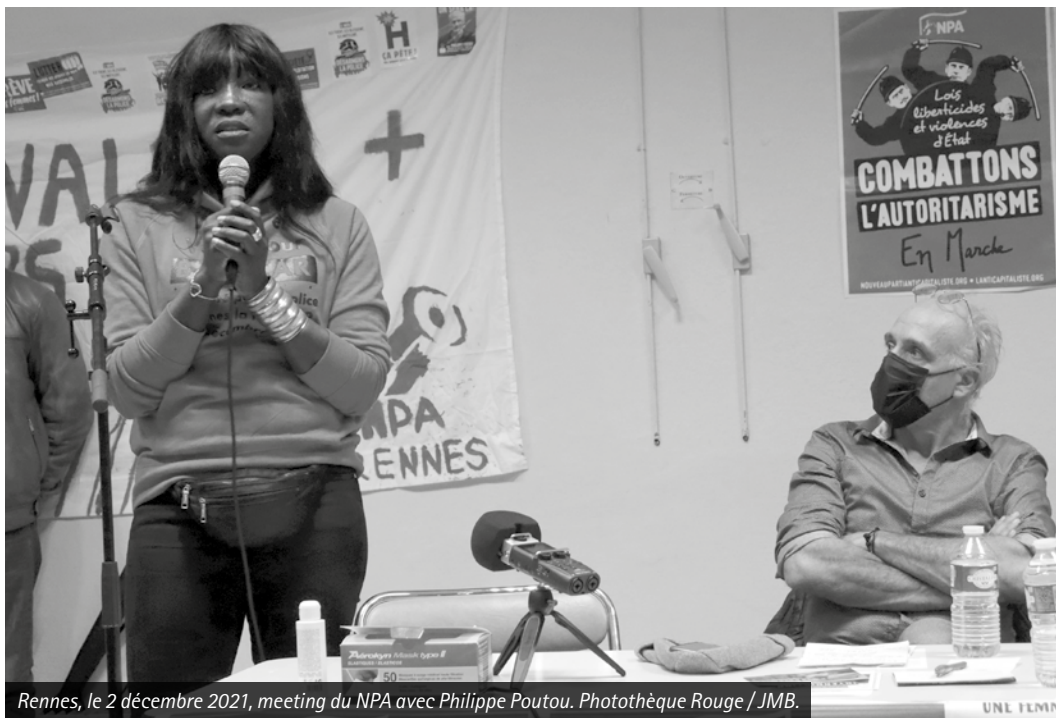
Rennes, le 2 décembre 2021, meeting du NPA avec Philippe Poutou.

commence tout de suite, cela commence avec cette campagne présidentielle. □