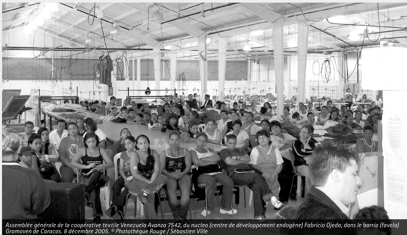
Assemblée générale de la coopérative textile Venezuela Avanza 7542, du nucleo (centre de développement endogène) Fabricio Ojeda, dans le barrio (favela) Gramoven de Caracas. 8 décembre 2005.

Le système bancaire et les grandes entreprises furent démantelés et subordonnés à des « Organisations de base du travail associé » (OBTA) unités de production plus petites supposées mieux contrôlées par les autogestionnaires. L'association libre des OBTA autour d'accords de « planification autogestionnaire » par en bas était encouragée et les droits d'autogestion furent étendus à tous les services publics : des « communautés d'intérêt autogestionnaires » d'utilisateurs, producteurs de ces services – une logique proche des débats actuels sur la gestion de « biens communs » par toutes les personnes concernées... Des « Chambres de l'autogestion » furent instaurées au niveau des communes et des républiques et provinces (ébauche d'une socialisation de l'État...).