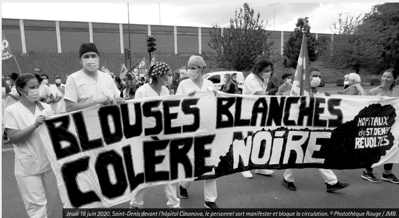
Jeu 18 juin 2020, Saint-Denis devant l'hôpital Casanova, le personnel sort manifester et bloquer la circulation.

néolibéralisme, faite notamment d'allègement des impôts sur les entreprises et la richesse, de remise en cause de tous les systèmes budgétaires de redistribution ; fait aussi d'allègements des cotisations sociales patronales permettant le financement de la Sécurité sociale. Le transfert d'une part plus importante de la valeur ajoutée vers le capital est allé de pair avec une réduction drastique des budgets sociaux.