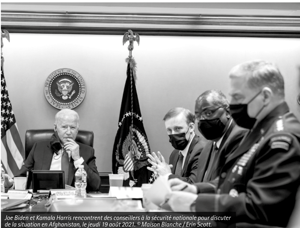
Joe Biden et Kamala Harris rencontrent des conseillers à la sécurité nationale pour discuter de la situation en Afghanistan, le jeudi 19 août 2021.

Alors qu'il était encore candidat, Biden déclara que l'assassinat de George Floyd était « un rappel tragique de quelque chose qui ne se limite pas à un incident isolé, mais qui participe d'un cycle systémique d'injustice profondément ancré, qui a toujours cours dans notre pays. » Malgré l'absence de collecte centralisée de données sur les assassinats de civils