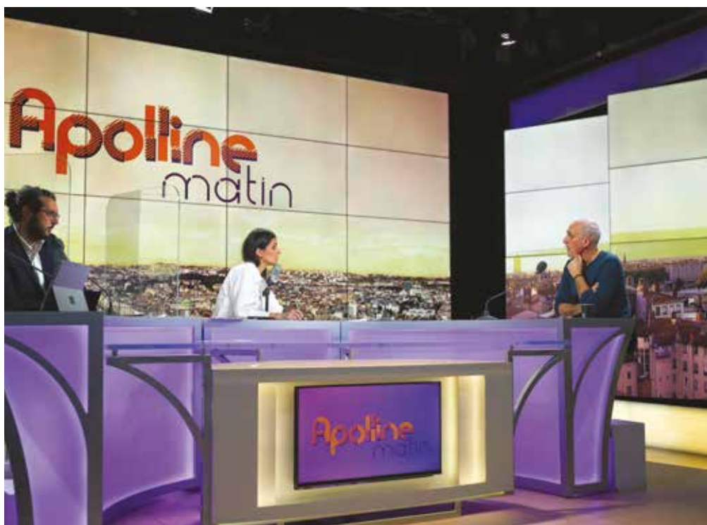
Philippe Poutou à l'émission Apolline Matin, avec Apolline de Malherbe sur RMC.

Illustration de Une : Meeting de Philippe Poutou à l'université Paris 8, Saint-Denis, 10 février 2022.