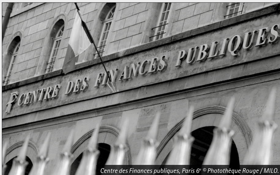
Centre des Finances publiques, Paris 6°

instaurer un système par points. Toujours avec les mêmes arguments quand il s'agit de détruire nos acquis sociaux, Macron n'avait pas hésité à affirmer que la mise en place de ce système à points pour nos retraites était une mesure de justice sociale. Mais c'est sans doute Fillon en 2016 qui a été le plus clair sur l'objectif de ce système : « Le système par points, en réalité, ça permet de baisser chaque année la valeur des points et donc de diminuer le niveau des pensions ». Malgré la mobilisation