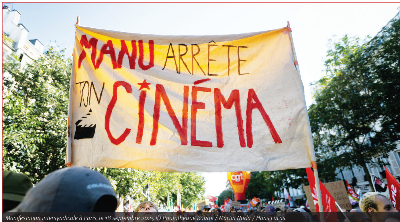
Manifestation intersyndicale à Paris, le 18 septembre 2025 © Photothèque Rouge / Martin Noda / Hans Lucas.

Le bouche à oreille des milieux conservateurs-catho-tradis ainsi que la diffusion par UGC ont largement contribué à ce résultat. UGC est actuellement détenu à 33% par Bolloré et une prise de contrôle à 100% est prévue d'ici 2028. Ainsi, non content de contrôler une partie de la production via Canal+, le milliardaire d'extrême droite pourrait contrôler une partie de la distribution (55 multiplex en France métropolitaine et je ne connais pas la situation dans les ex-colonies). On peut donc craindre dans le futur que, ce qui ne fut que des coups d'essais, réussis pour le second au moins sur le plan financier et public, ne se transforment en une part de l'industrie cinématographique en France. Car – il faut le rappeler – le cinéma est une industrie capitaliste et, s'il y a un public pour de telles œuvres, rien n'empêche d'autres films de cette mouvance d'émerger à l'avenir. □