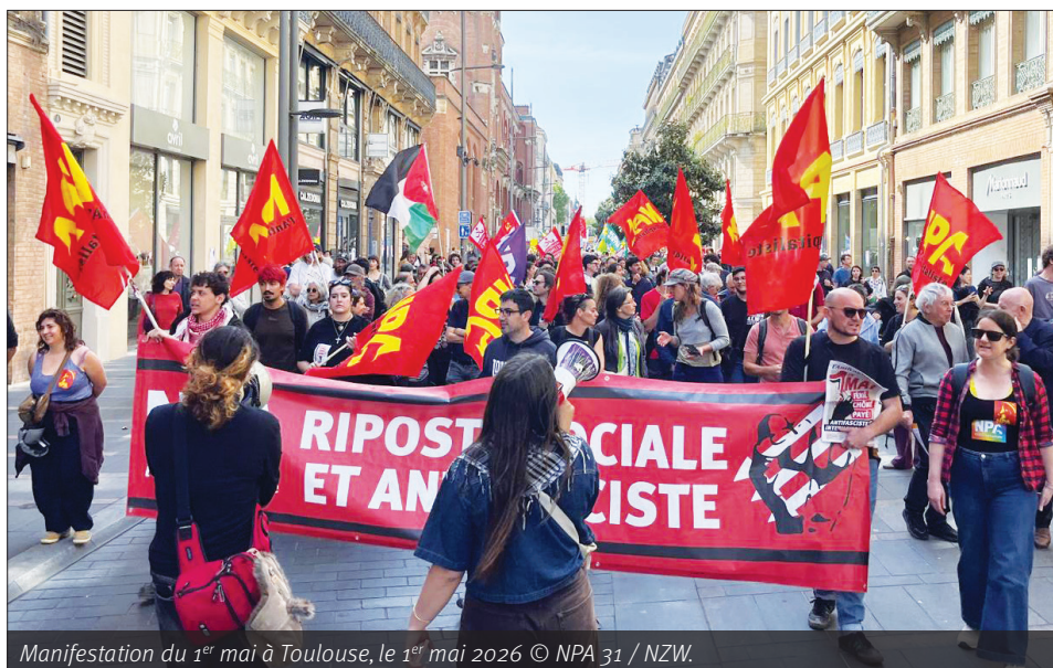
Manifestation du 1 er mai à Toulouse, le 1 er mai 2026 © NPA 31 / NZW.