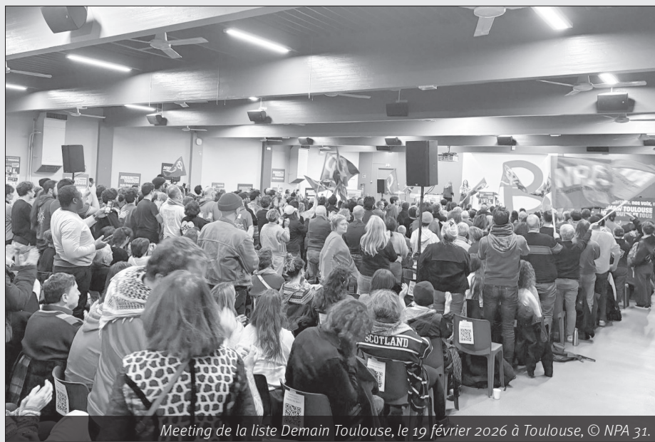
Meeting de la liste Demain Toulouse, le 19 février 2026 à Toulouse, © NPA 31.