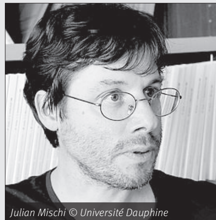
Julian Mischi © Université Dauphine

Ainsi, le ressentiment des ouvriers socialistes face aux dérives et prises d'autonomie des élus ne concerne pas seulement les parlementaires. Il s'exprime aussi dans les petites communes ouvrières et rurales, à l'égard de camarades devenus élus locaux, dont on craint qu'ils se détournent de l'action militante et modèrent leurs discours. Le rejet de la compromission sociale et politique entre en tension avec la volonté de ne pas laisser le pouvoir local aux mains des notables bourgeois. À l'approche du scrutin municipal de mai 1912, un ouvrier s'exprime dans le journal de la fédération socialiste de l'Yonne : « Peu de temps nous sépare des élections municipales ; il faut donc, dès aujourd'hui, songer à n'envoyer au Conseil que des candidats qui seront pour le bien-être des prolétaires. Fi des docteurs, des notaires, des rentiers capitalistes et de tous ceux qui ne briguent la place de conseiller que pour faire figurer un titre sur leurs cartes de visite. » 3